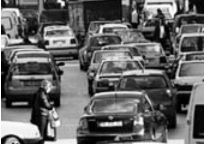
Ankara Akay Caddesi'nde karşıya geçmeye çalışan yayalar

ladığına sayı olarak bakalım. Bir de yayalar için kaçta başladığına bakalım. Bu rakam, kadınlar ile erkekler arasında aynı anlama mı geliyor? Kent içi ulaşım politikası düzenlenirken, yaya üstgeçidini yapalım, yaya altgeçidini yapalım. Işıklılandırma sistemini ayarlayalım. Katlı kavşak yapalım, orada trafik tıkanmasın. Gitsin başka yerde tıkansın, yaklaşımı hakimdir.” (16)