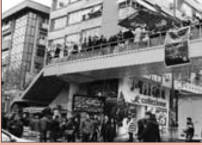
Kullanılmayan üstgeçitte 'Kısır günü', 10/02/2009, Radikal: Saltanata Son Platformu üyeleri Meşrutiyet Caddesi'ndeki üstgeçitte kısır günü düzenledi.

yapılacak alt-düzenlemelerin yanı sıra imtiyaz, kiraya verme, hizmet satın alma uygulamalarında da kadınları güçlendirici önlemler yer almalıdır.